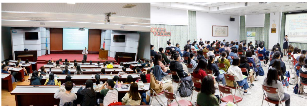
4樓國際會議廳場地

5. 空間配備：凡報名參與說明會之單位，每場次主辦單位提供配備如下：筆電、麥克風、單槍投影機、單槍投影布幕、三孔、兩孔 110V 插座。